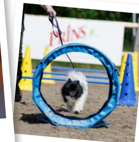
Workshops en demonstraties