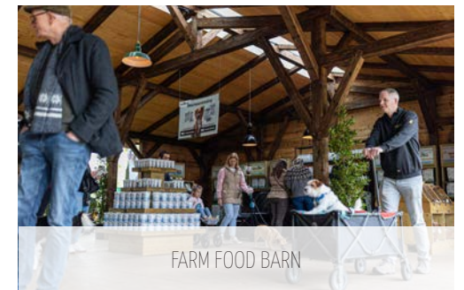
FARM FOOD BARN