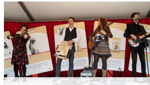
ROYAL CANIN RASKATTENCAFE