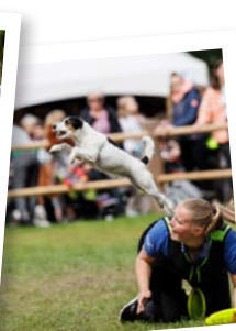
Spectaculaire demo's en shows