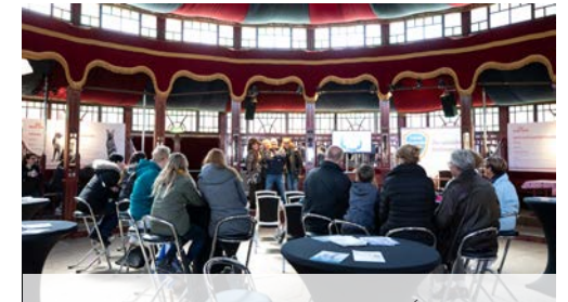
PRINS LEKKER IN JE VEL CAFÉ