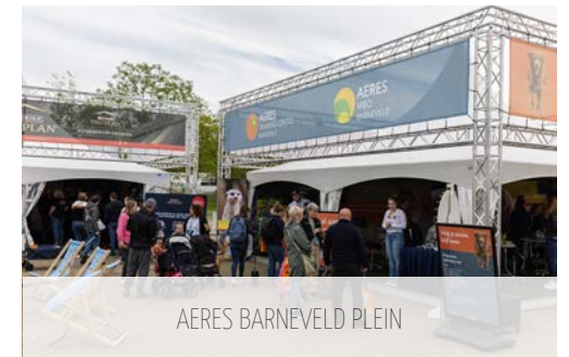
AERES BARNEVELD PLEIN