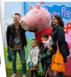
Leuke activiteiten voor jong én oud