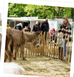
Kennismaking met het leven op de boerderij