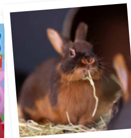
Presentatie van diverse konijnen en knagers