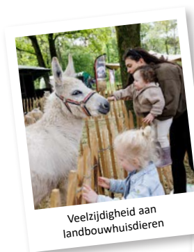
Veelzijdigheid aan landbouwhuisdieren

Er is een mooie verbinding tussen de area's die een variëteit aan stands bieden. Een tal van programma onderdelen zorgt voor een complete dag uit!