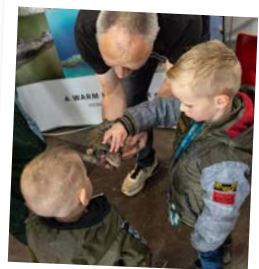
Maak kennis met fascinerende reptielen