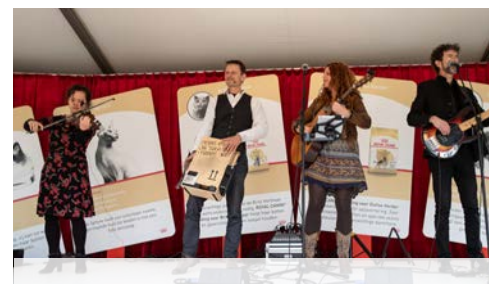
ROYAL CANIN RASKATTENCAFE