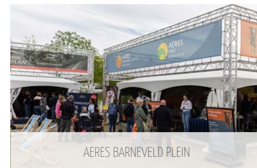
AERES BARNEVELD PLEIN