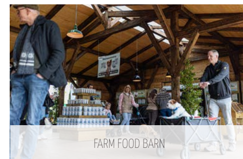
FARM FOOD BARN