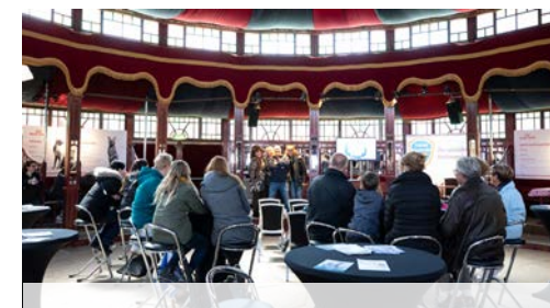
PRINS LEKKER IN JE VEL CAFÉ