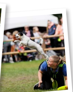
Spectaculaire demo's en shows